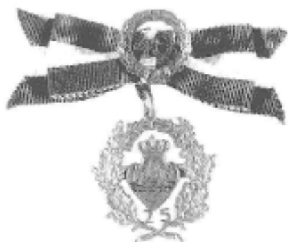
40 års Jubilæumstegnet