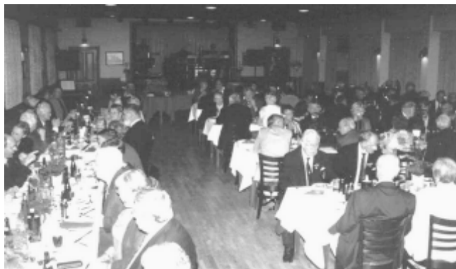
Et udsnit af det store selskab