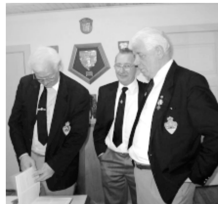
Der blev kigget meget i de gamle protokoller