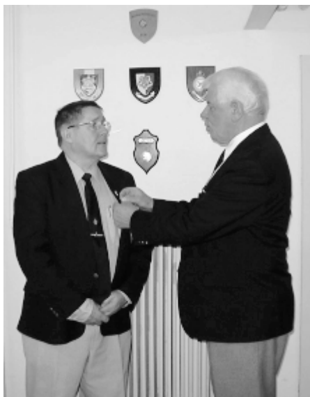
Præsidenten påhæfter Kystartilleriforeningens hæderskors

Formanden bød alle hjertelig velkommen og en særlig velkomst til vore gæster. I velkomsten blev lidt af afdelingens historie genopfrisket og den gamle fane, der blev indviet 2. september samme år som afdelingens stiftelse, var ophængt og præsenteret sammen med fanen fra den nu nedlagte Østsjællands afdeling . Vi kunne også mindes, at man i 1917 kunne afslutte et arrangement efter faneindvielsen på Ruin-terrænet i Vordingborg