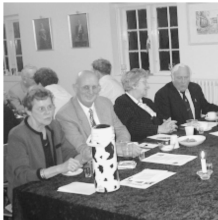
God stemning ved bordene